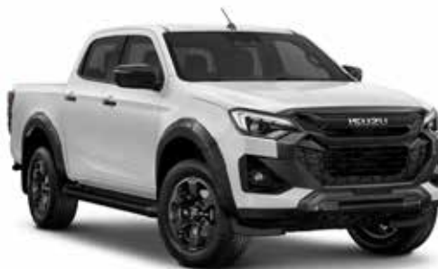
SPLASH WHITE (ZÁKLADNÁ)