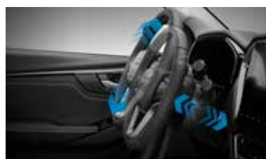
Výškovo a pozdĺžne nastaviteľný volant