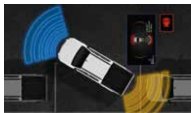
Parkovací asistent vpredu aj vzadu