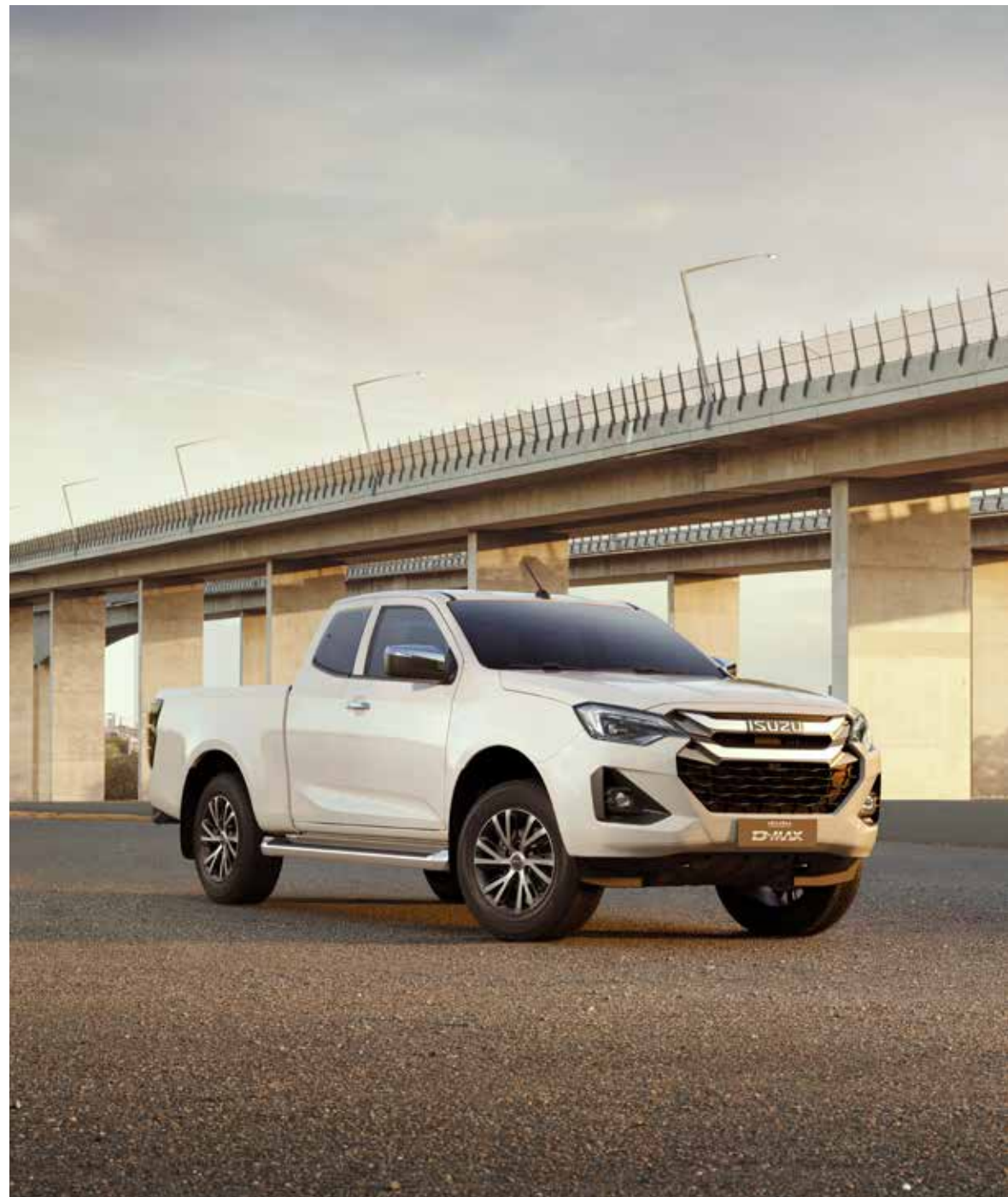
Na obrázku je ISUZU D-MAX LSE ako Space Cab v laku Splash White.

D-MAX kombinuje svoju robustnú povahu s vynikajúcim technickým vybavením. S ním zvládnete s ľahkosťou akýkoľvek terén a užívate si absolútnu stabilitu – aj na strmých svahoch alebo na klzkej vozovke. Asistent rozjazdu do kopca zabráni spätnému pohybu vozidla vo svahu. Asistent schádzaní z kopca vám poskytne ďalšiu kontrolu na svahoch. Pri manévrovaní môžete využívať parkovací asistent a kameru pre cúvanie, aby ste včas rozpoznali prekážky okolo vozidla. Okrem všetkého komfortu jazdy ponúka D-MAX aj ďalšie vymoženosti, ako napríklad automatické zamykanie dverí alebo svetlo Follow-Me-Home-Light, ktoré osvetľuje cestu domov. Isuzu D-MAX sa stáva zážitkom.