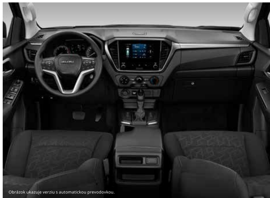
Obrázok ukazuje verziu s automatickou prevodovkou.