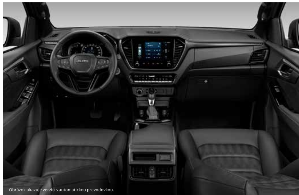
Obrázok ukazuje verziu s automatickou prevodovkou.