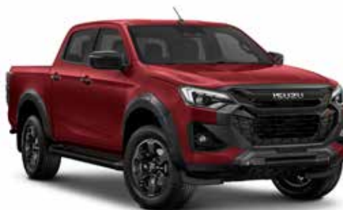
RED SPINEL (PERLEŤOVÁ)