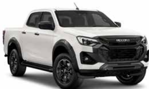
DOLOMITE WHITE PEARL* (PERLEŤOVÁ)