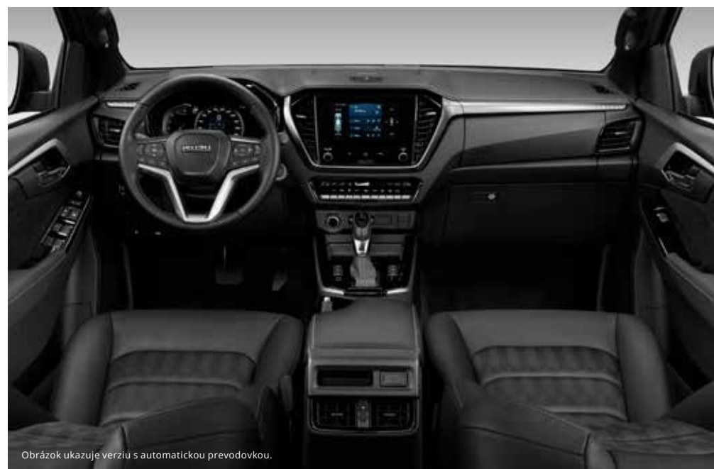
Obrázok ukazuje verziu s automatickou prevodovkou.