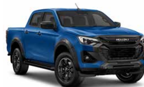
BIARRITZ BLUE (METALÍZA)