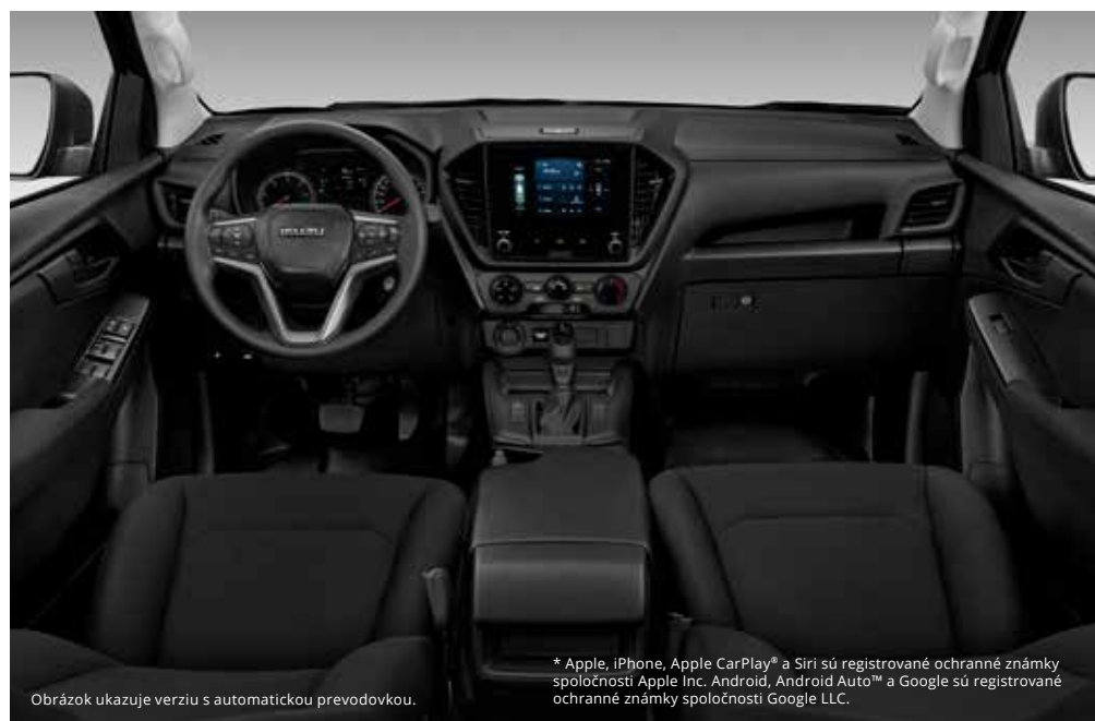
Obrázok ukazuje verziu s automatickou prevodovkou.

* Apple, iPhone, Apple CarPlay® a Siri sú registrované ochranné známky spoločnosti Apple Inc. Android, Android Auto™ a Google sú registrované ochranné známky spoločnosti Google LLC.