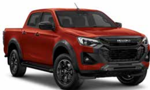
NAMIBU ORANGE (PERLEŤOVÁ)