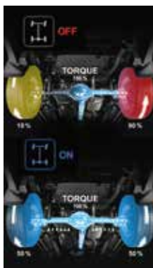
Možnosť aktivácie uzávierky diferenciálu