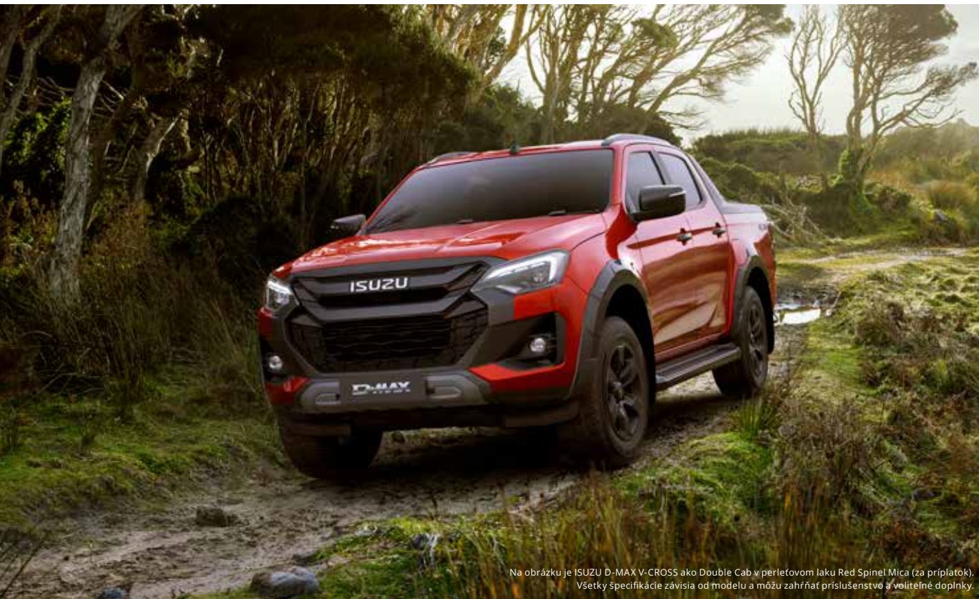
Na obrázku je ISUZU D-MAX V-CROSS ako Double Cab v perleťovom laku Red Spinel Mica (za príplatok). Všetky špecifikácie závisia od modelu a môžu zahŕňať príslušenstvo a voliteľné doplnky.

S vozidlom D-MAX zažijete rozmanitosť terénu pre vaše jedinečné potešenie z jazdy. S týmto partnerom pre terén môžete bez námahy prechádzať vodnými plochami až do hĺbky 800 mm a vďaka svetlej výške až 240 mm, prepínateľnému pohonu všetkých kolies a uzávierke diferenciálu prekonáte malé aj veľké prekážky. Predný nájazdový uhol 30,5 ° a zadný nájazdový uhol 24,2 ° umožňuje D-MAX prekonať aj tie najväčšie nerovnosti. Aby ste prešli aj tým najťažším terénom, dodávame štandardne náš pick-up s vysokým uhlom bočného náklonu a vynikajúcou stúpavosťou. Bez dodatočnej výbavy, a bez kompromisov.