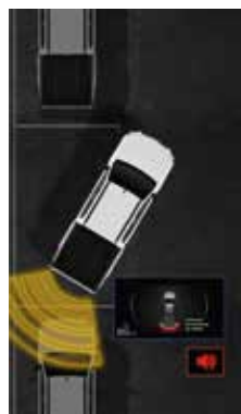
Parkovací asistent vzadu