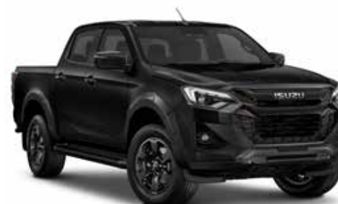
ONYX BLACK (PERLEŤOVÁ)