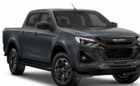
OBSIDIAN GRAY (PERLEŤOVÁ)