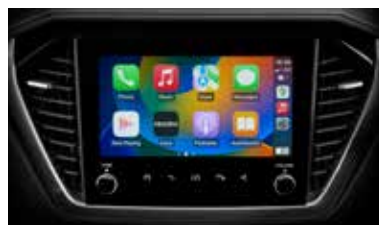
9-palcový systém infotainment