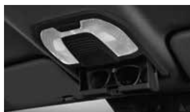
Čierny potah stropu