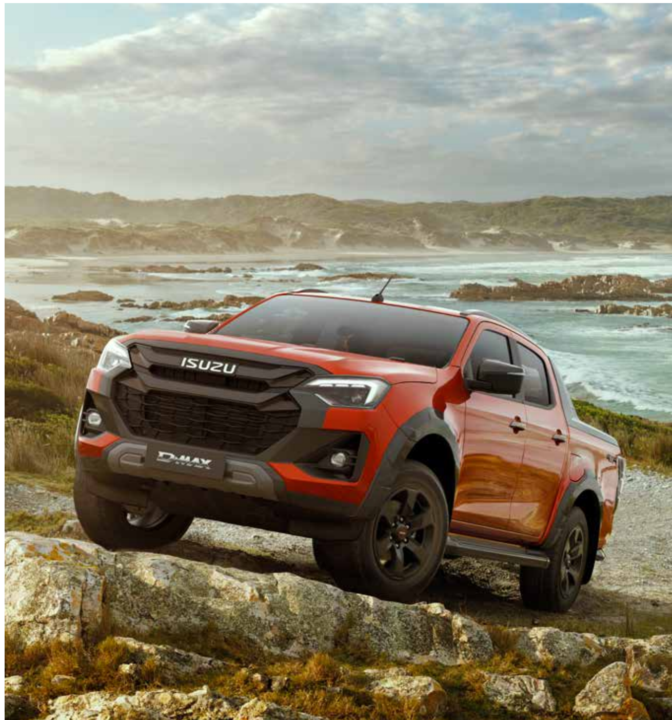
Na obrázku je ISUZU D-MAX V-CROSS ako Double Cab v perleťovom laku Namibu Orange Mica (za príplatok). Všetky špecifikácie závisia od modelu a môžu zahŕňať príslušenstvo a voliteľné doplnky.

Dokonalá symbióza všestrannosti, pohodlia a dizajnu. V-CROSS je chlapsky výkonný a zároveň elegantný. Vďaka tomu je novým lákadlom v segmente pick-upov. V-CROSS je ešte lepšie vybavený a zaujme špeciálnymi dizajnovými vlastnosťami a ešte väčším komfortom. Špičkový model má všetko, čo potrebujete, aby ste mohli s istotou začať svoje ďalšie dobrodružstvo. Zažiť ho štýlovo, pohodlne a bezpečne. Užite si jazdu – kedykoľvek a kdekoľvek.