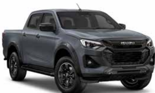
ISLAY GRAY (PERLEŤOVÁ)