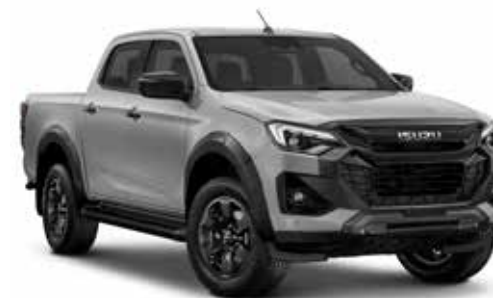
MERCURY SILVER (METALÍZA)