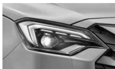
Zdvojené LED svetlomety