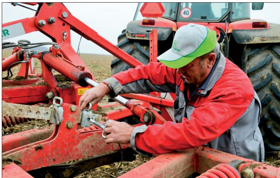
Hĺbka sa komfortne nastavuje na pravej aj ľavej strane.

Hlavnou úlohou radličkového kypriča v Blatnom má byť úprava kukuričnisk pred nasledujúcou orbou. Osivovú aj zrnovú kukuricu