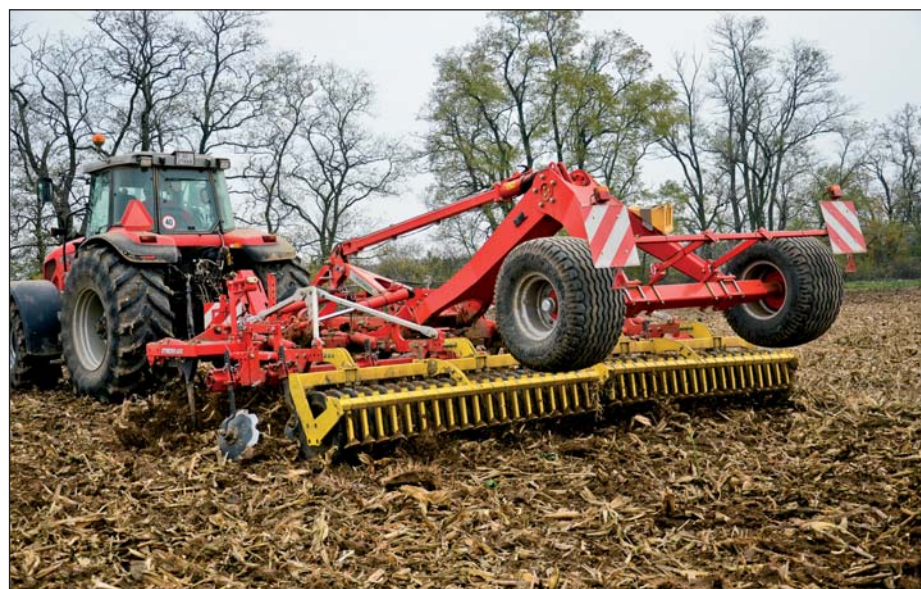
Hmotnosť nápravy sa tiahlymi rovnomerne presúva na celú šírku pracovných orgánov.

Rám na všetkých trojnosníkových Synkrách zhotovili z profilu 100 x 100 mm. Jeho svetlá výška je 85 cm, nosníky oddeľuje 75 cm. Na 6 m stroji sa nachádza celkovo 22 radličiek s rozstupom 27 cm. Stĺpice majú oblúkovitý tvar, ale aj ich nižšie uchytenie na nosníku má svoje opodstatnenie v lepšej práci. Stĺpice vybavuje Pöttinger nonstop pružinovým systémom istenia so silou 500 kg. Jeho vlastnosťou je, že pri