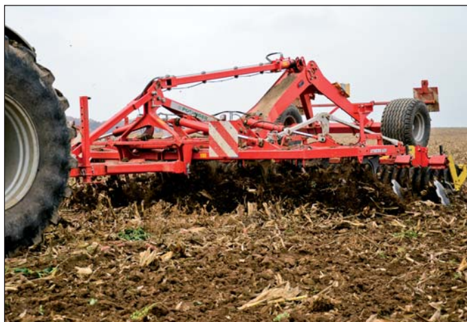
Pöttinger Synkro 6030 urobilo v strnisku kukurice dobrý dojem.