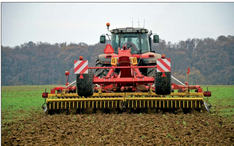
V lepších podmienkach s menším množstvom pozberových zvyškov sa Synkro môže použiť aj na predsejbovú prípravu.