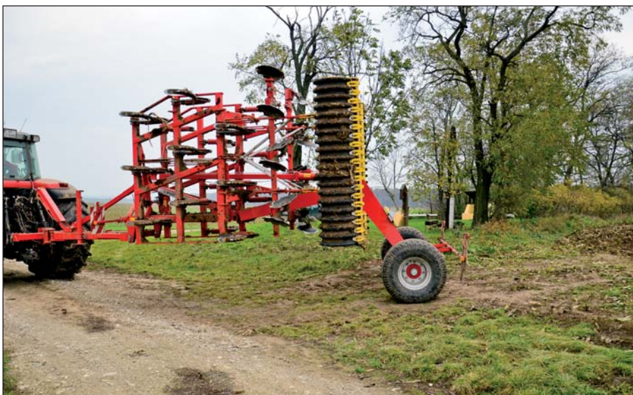
Na ceste sa ťahaná verzia prepravuje na podvozku s kolesami so šírkou 500 mm. Nízko položené ťažisko dovoľuje bezpečnú jazdu. Zmena z pracovnej do prepravnej pozície a naopak sa uskutočňuje bez nutnosti vychádzania vodiča z kabíny traktora.