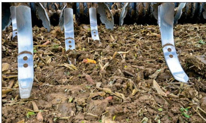
Akú budú mať životnosť radličky zo spekaných karbidov (vľavo) s trojnásobne vyššou cenou v porovnaní s klasickými? Podľa logiky a skúseností vydržia štvornásobne vyššiu dávku hektárov.