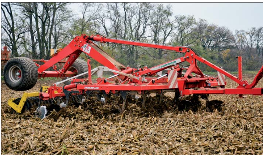
Výška rámu 85 cm a rozstup radličiek nebráni prechodu aj väčšieho množstva rastlinných zvyškov. Povrch pred valcami urovnáva rad tanierov s priemerom 45 cm.

Moderná mechanizácia v poľnohospodárstve®