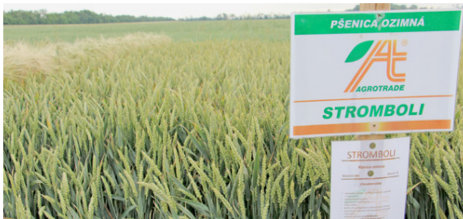
Bezosiťatá odroda pšenice Stromboli sa vyznačuje skorým odnožovaním, je odolná proti poliehaniu, výborne toleruje napadnutie hrdzou pšenicovou.

Dokončenie z 20. strany ktoré rastliny neboli schopné získať z vysušenej pôdy. Ďalšie listové hnojivo AT-Mikro zabezpečilo mikroprvky v období ich akútneho nedostatku. AT-Úroda je listové hnojivo, ktoré dodá potrebný dusík, či iné živiny v čase, keď je najnižšia mineralizácia a sprístupňovanie živín pre rastlinu a tak jej zabezpečí živiny práve v tom období, kedy potrebuje tvoriť úrodu a smerovať porasty k pekárskemu kvalite.