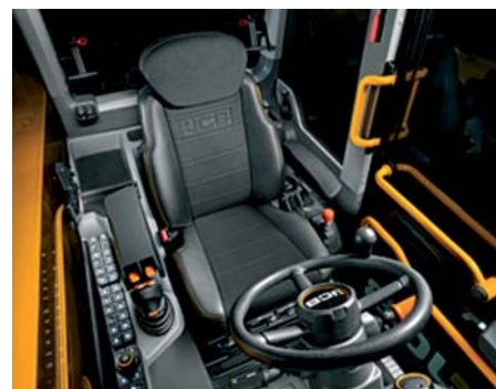
Kabína Command Plus ponúka najvyšší možný komfort a viditeľnosť pre obsluhu.