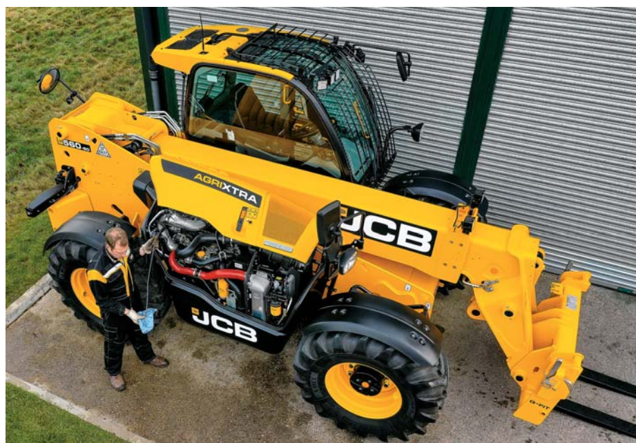
Vlastný motor JCB - DieselMAX má filter pevných častíc a SCR katalyzátor v jednom celku umiestnenom pod kapotou.