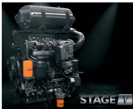
JCB DieselMAX Stupeň V.

motor EcoMAX boli odstránené. Používa sa už len agregát so zdvihovým objemom 4,8 l v troch úrovniach výkonu. Podme k zmenám.