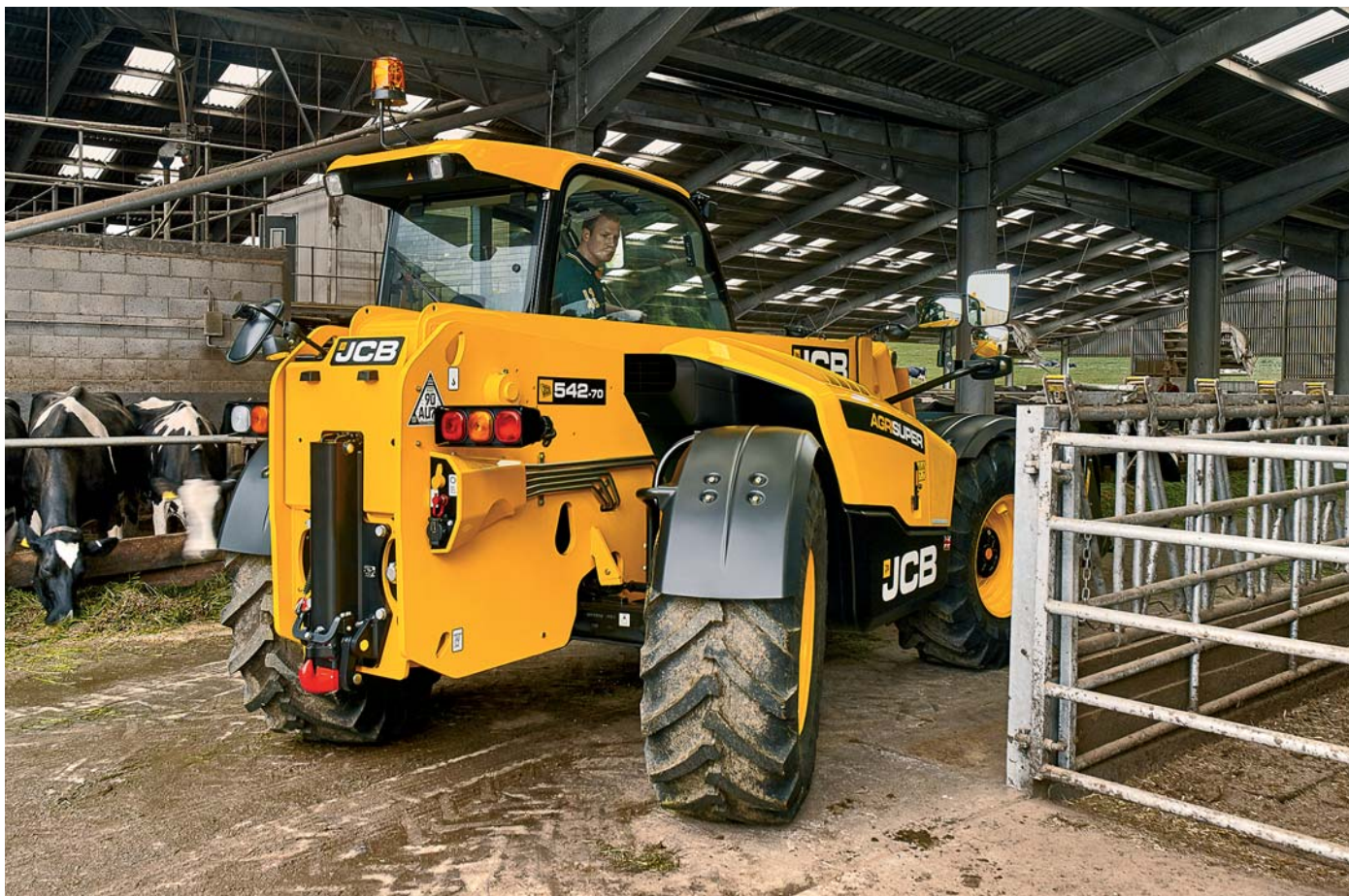
Výhľad sa z perfektného zlepšil na dokonaly vďaka odstráneniu výfukovej rúry.