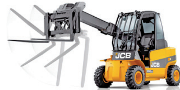
TELETRUK 35D 4X4.

prevodovkou s uzamykateľným hydrodynamickým meničom na všetkých