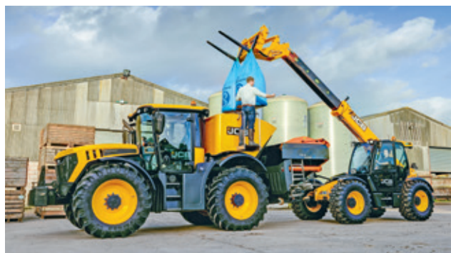
FASTRAC 4220 a LOADALL 541-70 Agri Pro.

vyhotovenie splňuje aktuálnu prísnu emisnú normu T4F bez použitia filtra pevných častí DPF. Motor EcoMAX zaberá menej priestoru ako konkurenčné, preto výhľad a manérovateľnosť u Loadallov sú bez kompromisov aj pri použití technológie selektívnej katalytickej redukcie SCR. Navyše pri