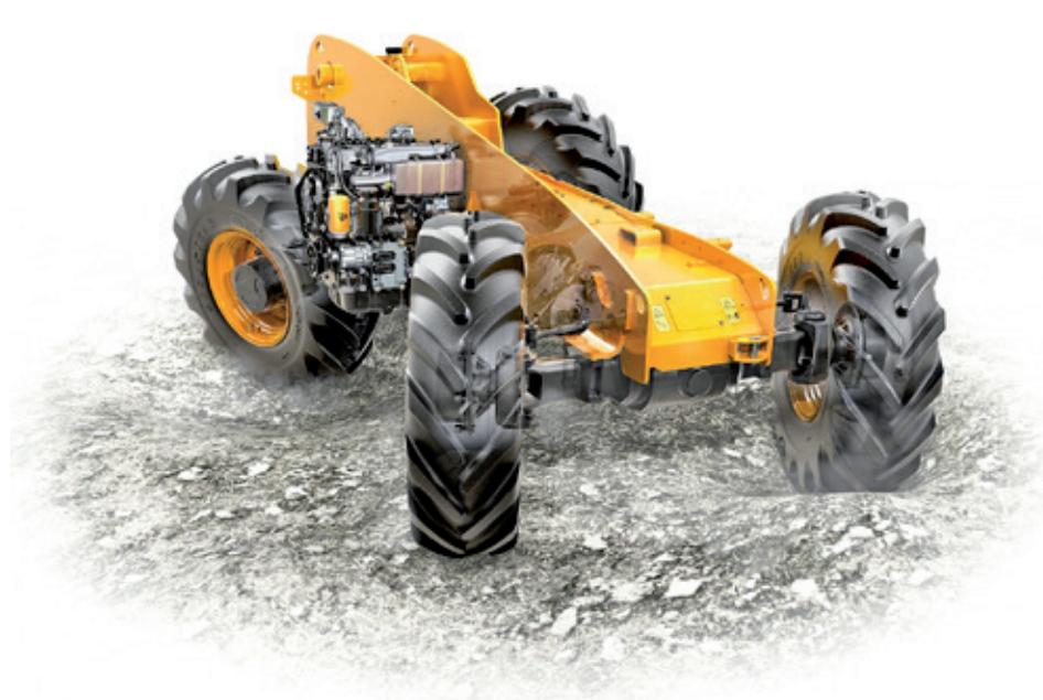
Rám a hnacie ústrojenstvo LOADALL.