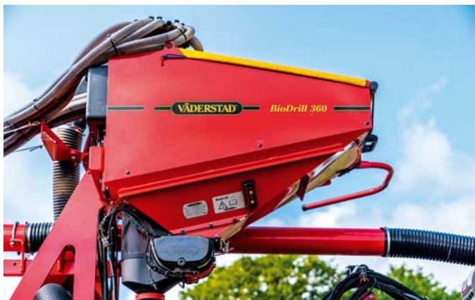
Sejačka na prísev BioDrill možno namontovať na akýkoľvek stroj.