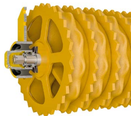
Na ložiskách valcov sa nachádza gumový prstenec, ktorý tlmí rázy z valcov na ďalšie časti stroja.