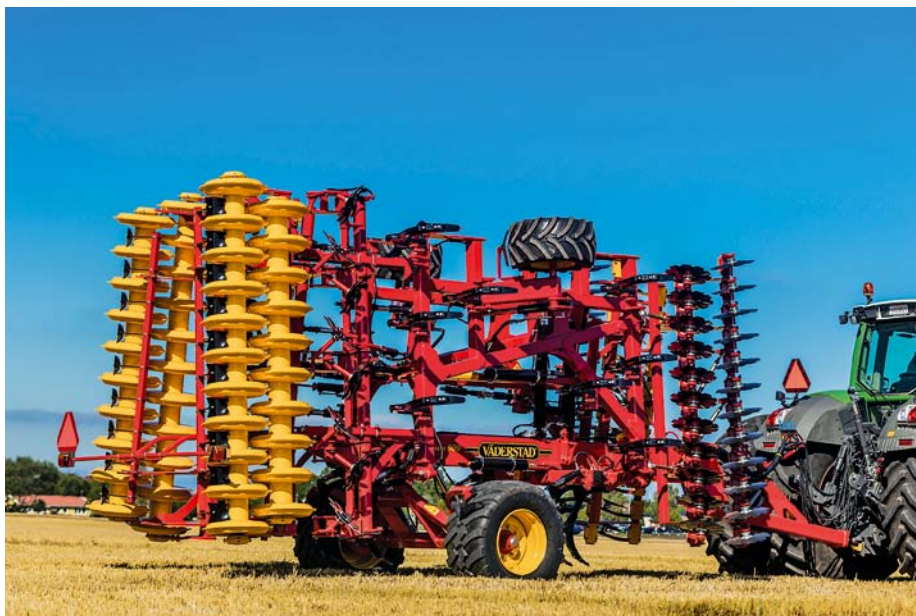
Stroj s dvojítým valcom SteelRunner, ktorý lepšie odoláva vlhkým podmienkam.