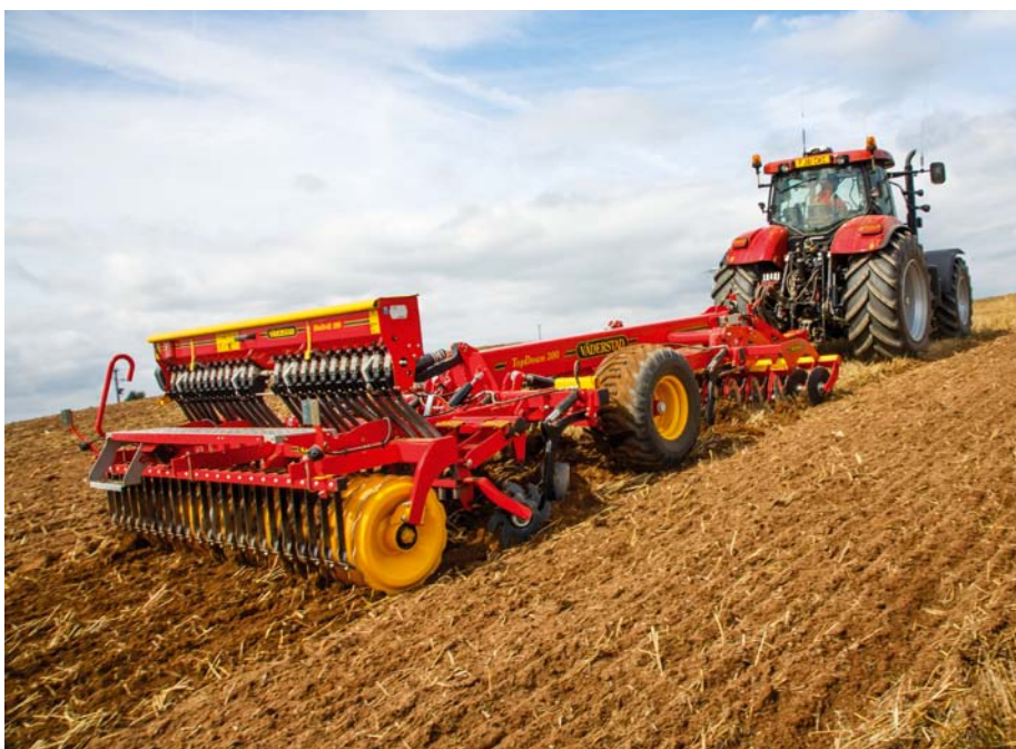
Riešením je aj táto verzia s hydraulickým pohonom pre stroje so záberom 3 a 4 m.

Prihnojovanie do depa využíva sadu na prihnojovanie za radličkami. Hnojivo sa umiestňuje do zásobníka na čelnom trojbodovom závese traktora. Môžete použiť