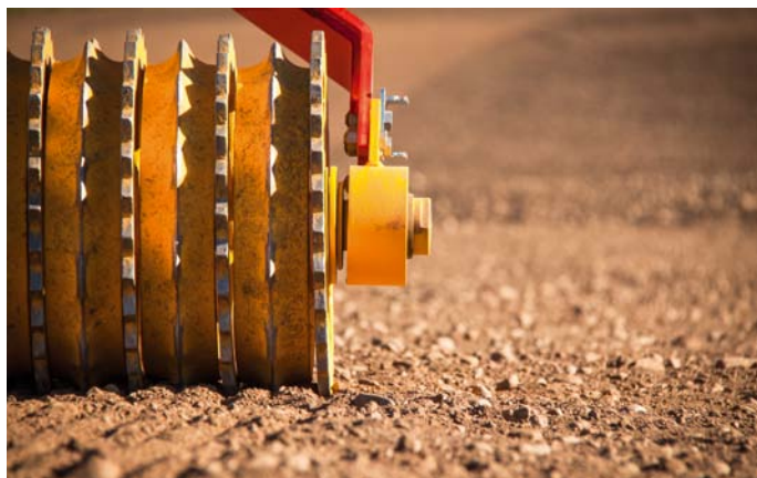
Väderstad valce Rollex a Rexius možno osadiť Crosskill, Cambridg (na obrázku) segmentmi.