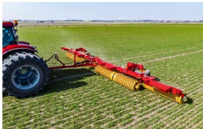
Valce Rexius sa vyrábajú do záberu 12,3 m. Vybrať si môžete typ valcov, ale aj typ urovňavacej lišty.