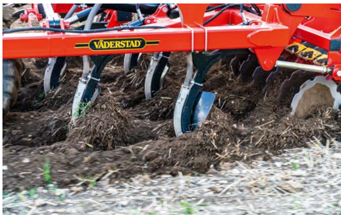
Väderstad ponúka aj riešenie zásobného hnojenia pre sejačky či pôdospracujúce stroje prostredníctvom svojho čelného zásobníka FH 2200. Možno však použiť aj zásobníky iných výrobcov. Na pravom snímku sa nachádza detail dodatočne namontovanej hnojnej pätky.