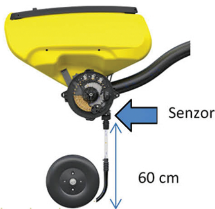
Riadený pohyb semien.

Hoci sejačky na presný výsev VADERSTAD TEMPO sa začali predávať len minulý rok, chýr o kvalite sejby a výkonnosti strojov sa rýchlo roznesol a k dnešnému dňu je v SR vyše 40 zákazníkov – majiteľov týchto sejačiek. Čo je na týchto strojoch také výnimočné, že sú neuveriteľne presné aj pri vysokej rýchlosti práce 14 – 18 km/h?